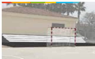
5. GRADERIA PISTA ESPORTIVA

Construcció d'una graderia a la nova pista esportiva de Marysol. Permetrà que el públic assistent a les diverses activitats esportives que s'organitzen tingui un espai en el qual seure més còmodament. Les grades estaran ubicades entre la pista i la caseta de l'associació de veïns.