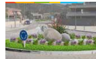
9. EMBELLIMENT ROTONDES

PL. INDIRA GANDHI - PL. TERESA DE CALCUTA