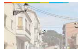
10. CANVI D'IL·LUMINACIÓ DIFERENTS CARRERS

Substitució de les lluminàries actuals per nous fanals més eficients i de menor contaminació lumínica.