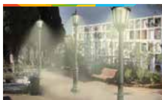
8. IL·LUMINACIÓ CEMENTIRI MUNICIPAL