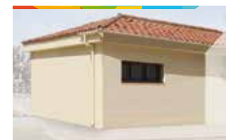
11. AMPLIACIÓ LOCAL SOCIAL VEÏNS

Ampliació de la sala de reunions de l'actual local social de l'associació de veïns de Marysol per cobrir les necessitats d'espai de l'entitat.