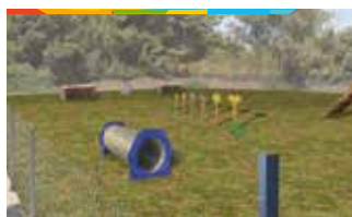
7. ZONA ESBARJO GOSSOS C. ROSA SENSAT

Creació d'una zona d'esbarjo per a gossos d'uns 1.000 metres quadrats, on les mascotes puguin córrer, jugar i relacionar-se entre elles. L'àrea estarà envoltada per una tanca metàl·lica i hi haurà bancs, papereres on dipositar els excrements, jocs i una font perquè els animals puguin beure aigua.