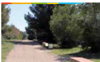
3. ZONA VERDA C. ROSA SENSAT

Arranjament de la zona, amb una extensió de més de 43.000 metres quadrats, per convertir-la en una via verda amb l'adequació del camí i la instal·lació de bancs i papereres i el plantat d'arbrat autòcton.