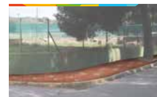
12. VORERA C. GUINEU - REINA FABIOLA

Pavimentació de la vorera, amb una extensió aproximada de 400 metres quadrats, per facilitar el trànsit de vianants i de persones amb mobilitat reduïda.