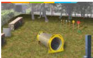
1. ZONA ESBARJO GOSSOS CAMÍ DEL VENDRELL - C. OSSA MAJOR

Creació d'una zona d'esbarjo per a gossos d'uns 1.000 metres quadrats, on les mascotes puguin córrer, jugar i relacionar-se entre elles. L'àrea estarà envoltada per una tanca metàl·lica i hi haurà bancs, papereres on dipositar els excrements, jocs i una font perquè els animals puguin beure aigua.